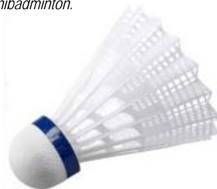
DIAGRAMA B. Volante de Minibádminton.